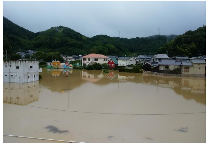
沢田橋南保育園 近辺 (場所④)