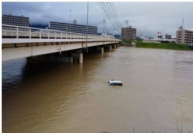
旭川から百間川(一の荒手)へ流入状況(場所①)