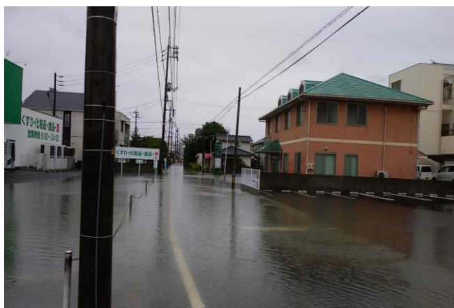
幡多小学校校門前の道路(場所③)