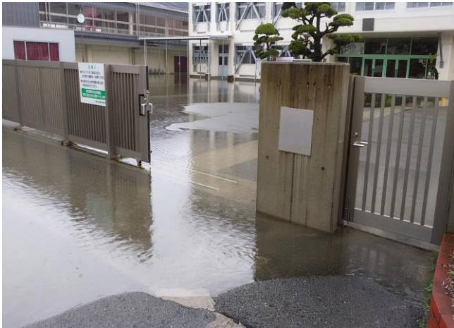
幡多小学校校門から校舎、体育館