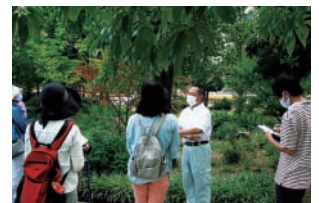
D 公園の植物みてあるき