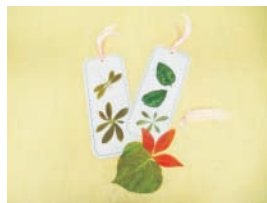
A 葉っぱで遊ぼう！ in浦安西公園