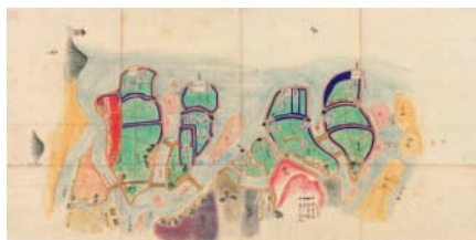
摂海御警衛場所并御台場御絵図