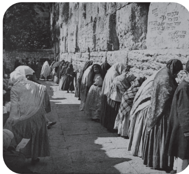
嘆きの壁(エルサレム、1900年ごろ撮影)