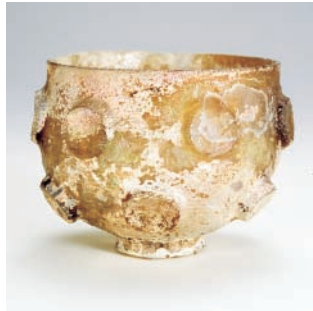
浮出切子碗 ガラス 4-6世紀 メソポタミア