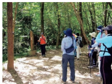
● ノルディックウオーク体験