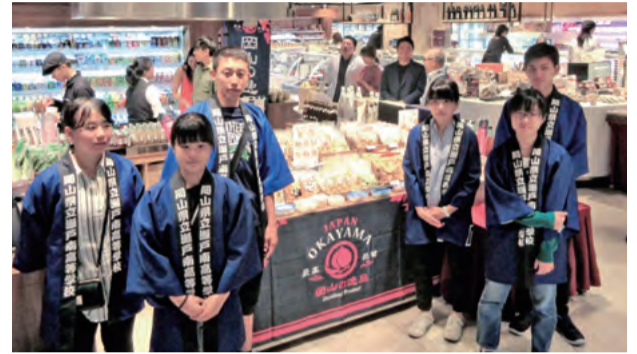
台湾で「瀬戸南おかき」を販売

瀬戸南高校では、「グローバル市場を目指す『攻めの農業経営』人材育成」に取り組まれました。農産物の生産とあわせて加工・販売を行う農業の6次産業化のため、ビジネスプランの作成や、商品開発、模擬会社の設立などを実施。また、新たな農業ビジネスの可能性を探るため、台湾で日本産農産物の流通状況の視察などを行いました。