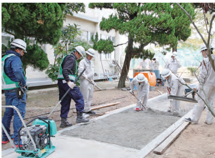
企業の協力による、高機能コンクリートの比較実験

そのほかの高校でも、AIを活用したスマート農業を学ぶプログラムや、観光産業振興に焦点を当てたビジネスリーダーの育成など、時代をリードする教育内容を研究しています。