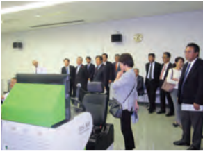
運転免許センター(岡山市)

運転免許センターでは、運転免許試験の実施や免許の更新業務のほか、交通安全教育の実施により、交通マナーの向上や交通ルールを遵守する意識の浸透を図ることで、交通事故の防止に取り組んでいます。