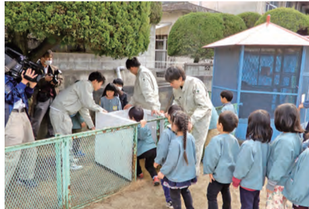
保育園のウサギ小屋に二重扉を設置

笠岡工業高校では、生徒が身に付けた専門技術を活用して地域に貢献する「笠工テクノ工房」を実施。地域の小中学校や市役所などから寄せられる「こんなものを作ってほしい」といった依頼に対し、打ち合わせから企画、制作、納品まで生徒が主体となって学科を超えたチームで取り組んでいます。