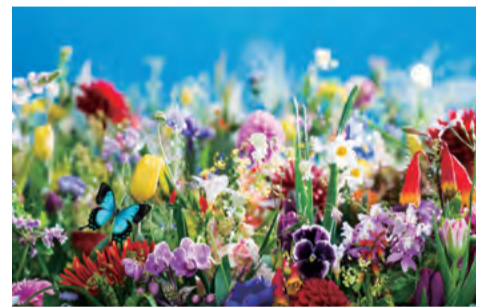
earthly flowers, heavenly colors (2017)

写真家の枠を超え、映画、デザイン、ファッションなど多彩な活動をしている蜷川実花。本展では、「虚構と現実」をテーマにアーティストの本質に迫ります。色鮮やかな花々を撮影した《永遠の花》や《桜》をはじめ、著名人やスポーツ選手を撮影した《Portraits of the Time》、新境地となった《うつくしい日々》の全4章を展示します。