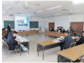
総社南高校(総社市)

総社南高校では、語学力やコミュニケーション能力をはじめ、社会貢献活動や各種コンテストへの出場などを通じた主体性や積極性、姉妹校交流などを通じた異文化に対する理解や日本人としてのアイデンティティを持つ人材の育成に取り組んでいます。グローバル人材の育成の取り組み状況や、学校生活の状況について説明を受けた後、校内を視察しました。