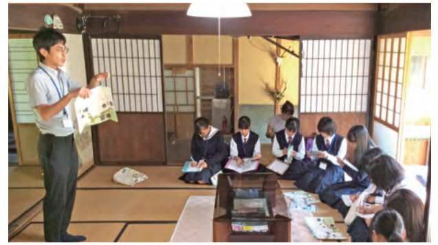
地域で運営するゲストハウスの仕組みについて学ぶ

林野高校では、地域にイノベーションを起こすことができる人材や、持続可能な社会を創造できる人材の育成を目指して、地域の課題を理解し、解決策を提案する「みまさか学」を開講。生徒たちは、地域の観光スポット・湯郷温泉を盛り立て、観光客を増やす方法の探究などを行っています。また、生徒たちの活動に対して、地域連携組織が外部の視点から評価を行っています。