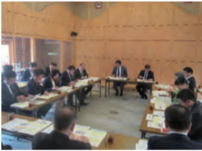
やかけ町家交流館(矢掛町)

江戸時代に宿場町として栄えた矢掛町では、歴史ある古民家を宿泊施設として再生し、その運営を企業が行うことで、地域の魅力発信や賑わいの創出がなされています。