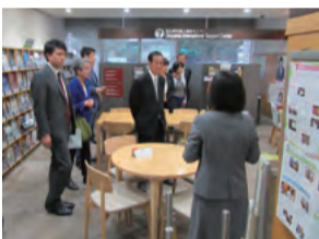
外国人相談センター(岡山市)

岡山県外国人相談センターは、改正入管法の施行に伴い、新たな外国人材の受け入れが始まったことを受け、外国人労働者などの生活をサポートするため、昨年4月に開設されました。多言語による生活相談をはじめ、在留資格、出入国手続き、雇用問題など、外国人からの各種相談に対応しています。