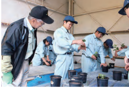
地元菊花展出展を通じ、栽培技術と地域について学ぶ／井原高校

「おかやま創生 高校パワーアップ事業」推進校においては、地元自治体や企業、NPO法人などからなる地域連携組織を設置。学校と地域の関係者が直接話し合うことにより、地域の課題やニーズを踏まえ、地域資源の活用や地域の課題解決を目指した教育を実施し、地域に貢献する人材の育成に取り組んでいます。