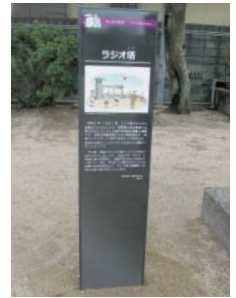
平成29年度設置 北区津倉町地内

市内のさまざまな地域の歴史や文化の由来などを広く現地で紹介する、説明看板「岡山歴史のまちしるべ」について、地域の団体からの設置提案の募集を実施する予定です。募集要項・企画提案書は、各区役所・支所・地域センター・公民館（HPからも入手可）で2月28日（金）から配布します。