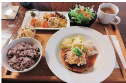
▲指定の飲食店メニュー(例)

指定のアプリなどを使って歩く、フィットネスジムで運動、飲食店での食事、薬局での栄養指導やイベント参加などで専用カードにポイントがたまります。市内に150店舗を超えるポイント対象店舗があります。