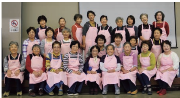
▲「ふれあい上道」のメンバー

その活動のなかで、年2回の定期開催を続けている「元気の出る会」は、地域の高齢者、特別養護老