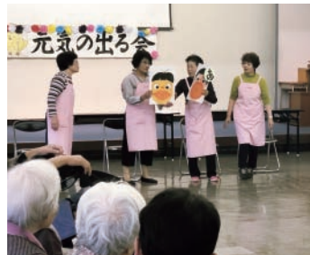
▲「元気の出る会」での様子

人ホームの利用者・スタッフを対象として、腹話術、アコーディオン演奏、独特のおしゃべりで楽しませながら行うオリジナル運動などで、参加者みんなを笑顔にしています。