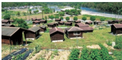
▲牧山クラインガルテン

平成8年に開園した市民農園で、牧山地区の豊かな自然の中で野菜や果樹などを育てることができる貸し