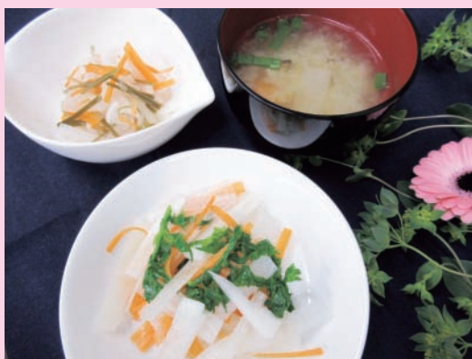
▲みそ汁(右奥)、なます(左奥)、サラダ(手前)