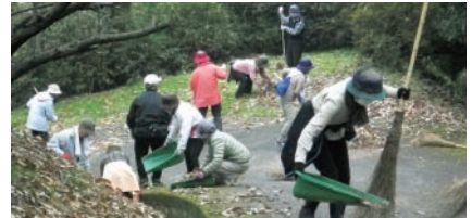
▲鉄砲山クリーン作戦の様子