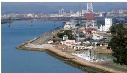
▲三幡港周辺（旭川河口）

から昭和の初期までの間、国清寺（現在の中区門田屋敷）と三幡港を三幡鉄道が結んでいました。