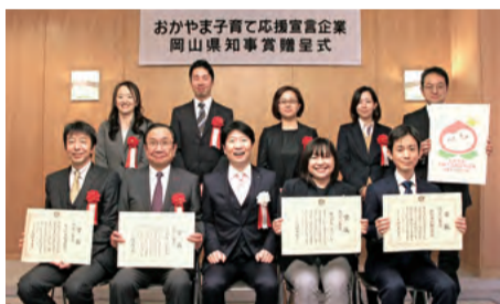
平成30年度県知事賞贈呈式