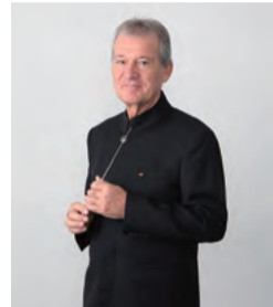
首席指揮者 ハンスイェルク・シェレンベルガー

県内唯一のプロオーケストラである「岡山フィルハーモニック管弦楽団」によるフルオーケストラ公演を県主催で開催します。指揮には、首席指揮者のハンスイェルク・シェレンベルガー、ソリストには岡山県出身で第9回東京音楽コンクール第1位のヴァイオリニスト、岸本萌乃加を予定しています。ぜひ、この機会にプロオーケストラの演奏に触れてみませんか。