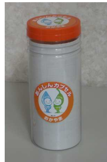
あんしんカプセルおかやま

ご本人様が病気やケガで倒れて、会話が出来ない状態になっていても、救急隊員や第一発見者がカプセルの情報を確認し、医療機関へ引き継いだり、緊急連絡先にある親族等との連絡がスムーズに行えます。