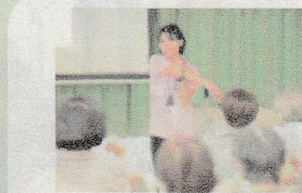
安全に取り組める体操