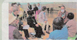
交流することで脳活性化