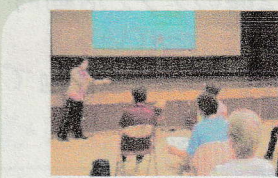
わかりやすく楽しい講話