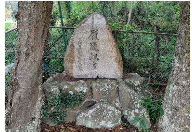
りどうたんたん 今も校庭に残る「履道坦々」の石碑は 100周年記念事業で作られた