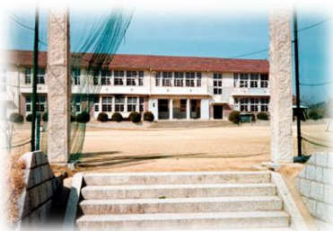
正門及び昭和29年完成の校舎

令和3年度、最後の卒業生2人を加え、 明治6年の開校以来、6,683名 (犬島小・分校は1,037名) の卒業生を送り出しました!