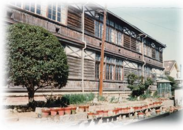
明治34年完成の校舎