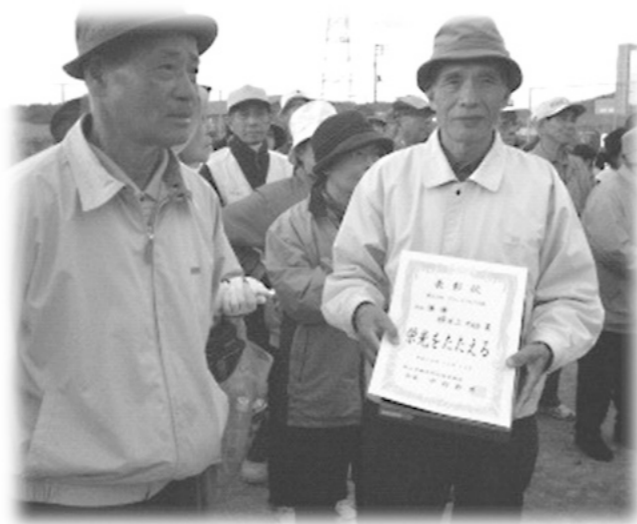
(横井学区体育協会主催)

行楽日和の晴天の中、小学生からお年寄りまで元気はつらつ頑張りました。各町内会より2チーム12名が参加し、少し寒い風の強い雨上がりの上々のコンディションの中で8:40プレー開始で行われました。2ゲーム16ホールで横井上チームは優勝、個人では優勝と3位入賞と、横井上町民皆様の応援のお蔭と感謝しております。詳細は次のとおり