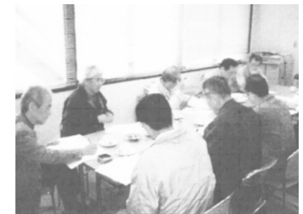
岡山市との話し合い