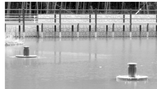
稼働中の小幸田池浄化施設

完成から一年が経過したが、過去3回(2005年5月・8月・12月)の水質検査が実施されましたが、農業用水基準を越えており、農業被害や公共水域の汚濁が懸念されることから、過去3回の話し合いを踏まえ、津高支所において、環境局等から、①施設の本格的機能には、時間が少しかかる。②用排水路、農業用水としては一部数値の高いものがあるが異常とはいえない。等の見解ではあるが、今後とも問題解決が必要であるとの合意を得て、対策として半田山ハイツ町内会、マスカット団地町内会において、合併浄化槽の設置推進、家庭における浄化対策等生活排水の水質改善に努力するよう啓発活動を推進していますが、完全な対応は不可能であることから、3町内会(横井上・半田山・マスカット)連名で、この団地に計画のある下水道整備事業の内、小幸田池へ生活排水が流入している地区を最優先に工事を推進し、安全で快適な環境整備するよう2回目の要望書を岡山市に提出した。岡山市として、引き続き調査活動を実施するとともに、浄化システムの今後の管理等については、引き続き話し合うこととした。