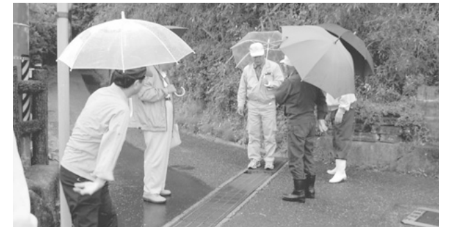
要望箇所の調査(平成18年5月16日)