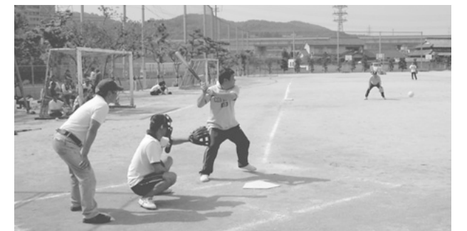
成年部 親睦ソフトボール大会(平成18年5月21日)