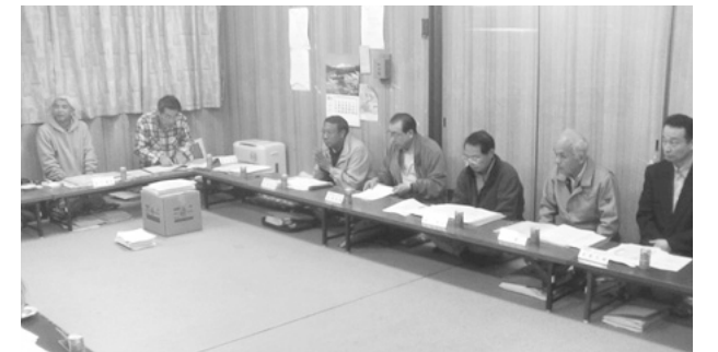
第1回町内会委員会(平成18年4月15日)