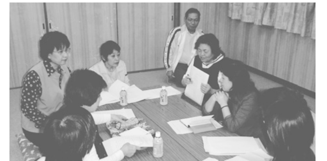
女性部設立総会(平成18年5月14日)