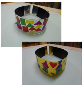
これを付けて、頑張りました！