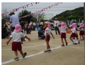
先生になって、 体操を教えてあげたよ！