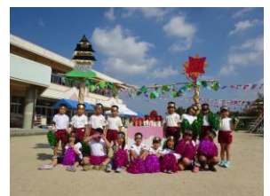
亀山城とブドウ畑、 誕生ケーキと一緒に 記念写真！