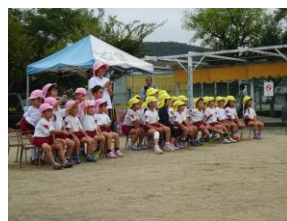
応援もがんばりました！ 「おかあさん、がんばれ〜！」