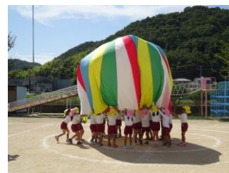
運動会も成功するかな？