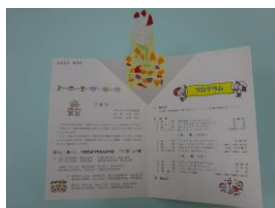
ケーキが飛び出すよ！