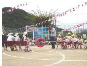
力を合わせて、 「よいしょ！よいしょ！」