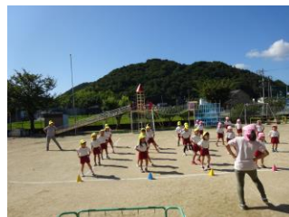
おかやましみんないそう