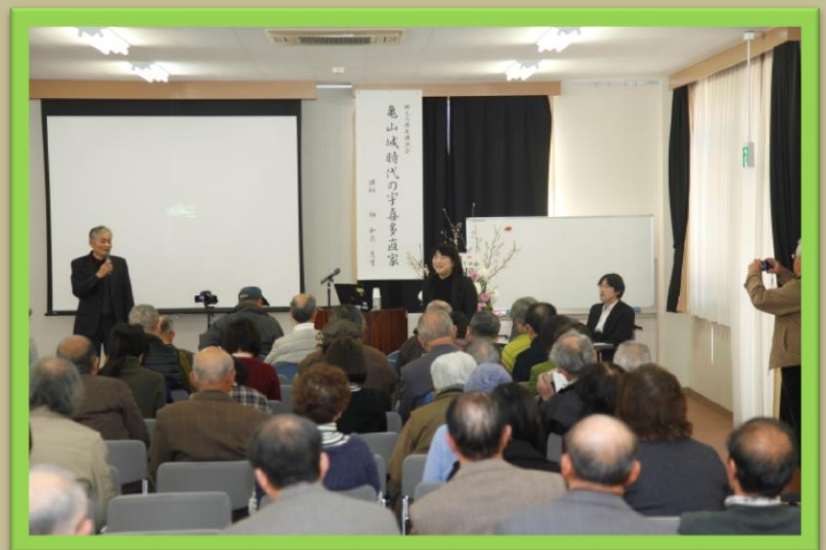
保存会会長より開会式の挨拶