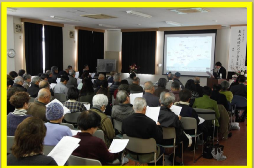
皆さん真剣に聞き入っています