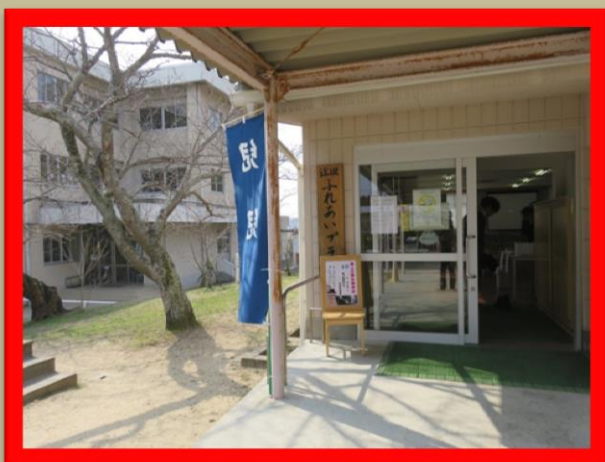
講演会の会場入り口