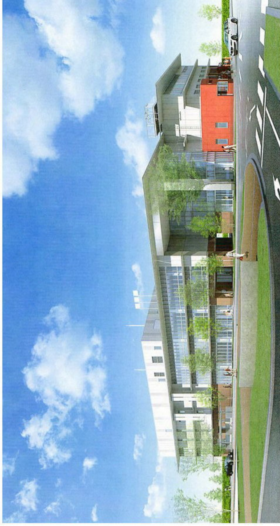
岡山市東区役所等庁舎完成予想図