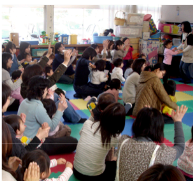
子育て広場活動の様子