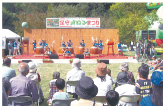
まつりを盛り上げた小学生たち

その足守藩陣屋跡周辺を会場とし、昨年10月18日「第20回足守メロンまつり」が地元各種団体で構成する足守地域活性化推進事業実行委員会主催のもとに、地域の親睦・活性化を目的に盛大に開かれました。まつりの目玉である足守メロン（アールスメロン）は足守地区の特産であり、生産者が丹精込めた網目の美しいメロンは甘みも美味さも格別で評判は上々、この日は市価より割安で即売され試食もできるとあって、朝早くから地域内外からの来場者で長蛇の列ができ、販売開始を待つ盛況ぶりでした。このほか会場には地域各種団体が出店する飲食や特産品コーナーのテントが立ち並び、特設ステー