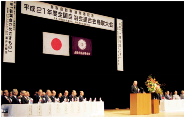
全国から9000余名の自治会・町内会関係者を集めての開会式

開催地鳥取県の皆様には、準備・大会運営で大変お世話になりました。心から感謝の気持ちで一杯です。また、全国の自治会関係者の熱意と住民のための町内会・自治会の存在意義を改めて感じとった次第であります。