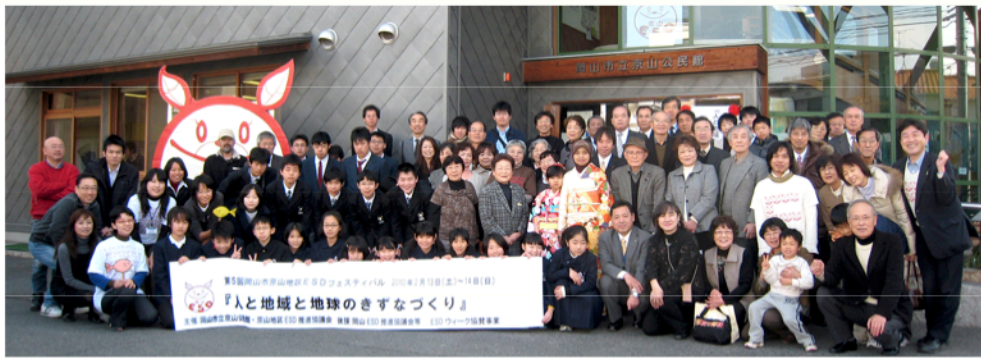
第5回岡山市京山地区ESDフェスティバルに参加のみなさん