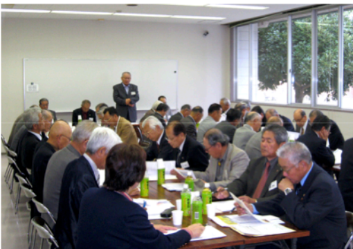
松阪市自治会連合会との懇談会風景

さらに、市議会に対しては、市議会議員の定数削減、議員報酬の削減、政務調査費の用途公開等、かなり踏み込んだ要望活動を行い、連合自治会の活動が自主的かつ非常に精力的に展開されていると感心した。