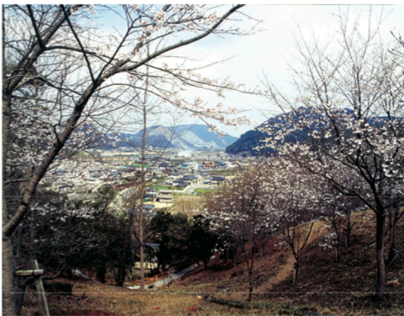
御津中学校付近から見渡した御津町

山が多いのですが、農地はほ場整備が進み、御津工業団地など企業誘致も図られ、農・工一体的な町づくりが行われています。御津中学校区で、御津、御津南、五城の3小学校