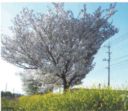
桜花爛漫千両街道の大島桜

七区小学校、七区保育園も充実して住み良い地区です。入植後西七区区会を作り地区で色々な行事をしています。西七区、北七区合同で子供夏まつりをして、子供花火等楽しい行事をしています。婦人会の皆さんが七区小唄のおどり等祭りを盛り上げています。 毎年西七区地区で西七区ふれあいサロンを開催し、健康体操、ゲーム、歌を唄ったの