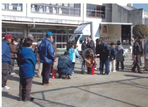
防災研修会に参加の地域のみなさん

平成21年には、町内会総会において自主防災会の設立が承認された。今後は、自主防災会を中心に現場で活動できるように訓練を重ねていく予定である。