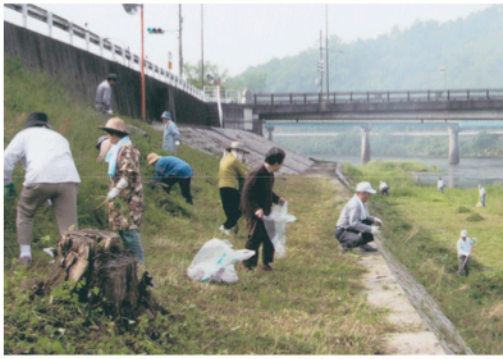
清掃活動に精を出す愛護会のみなさん

JR津山線岡山～津山の間、ふくわたり、平行して国道53号が走り、その西側にゆったりと旭川が流れています。