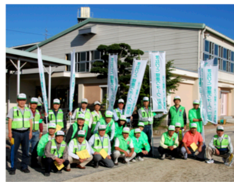
まなびと健康ウォーク実行委員会のみなさん

『不審者を入れない育てない』を合言葉に100名以上の方が交代で毎日子供達の見守りとあいさつ運動を続けております。また、『芳明見守り隊』として、8台の青パトが活動しております。