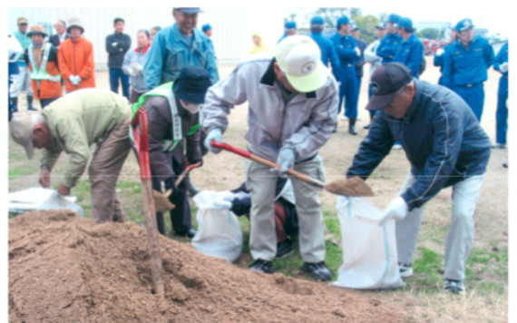
土嚢づくりに精を出す地域のみなさん

変わりよりの激しさを痛感する。独居老人の増加、振込め詐欺、悪徳商法、誘拐など住民の安全・安心を脅かす要因が次々に発生している。行政もそれらに対策をたててはいるが、効果は地域住民が結束して、目を光らし行動を起こすことにかかっている。それと地域に住むことがよかったと思える共同社会を作ることを中心にした活動をするのが、これからの地域コミュニティを含む連合町内会の一番重要な仕事になるだろうと思っております。