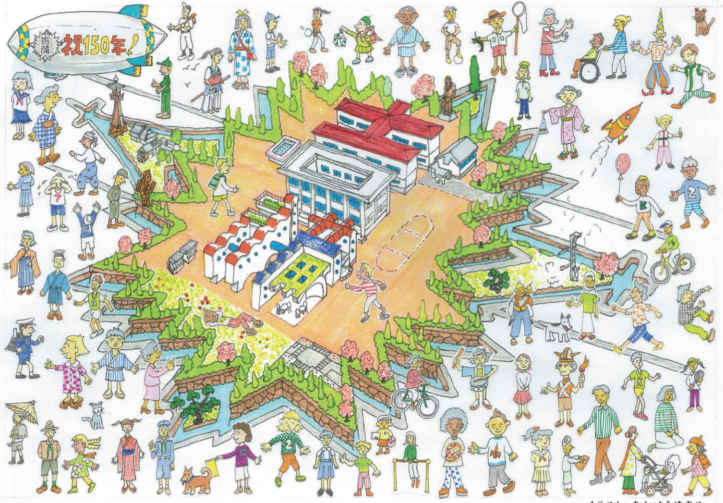
イラスト：たかはらゆきこ

現在150周年記念事業に実行委員会を中心に取り組んでおられますが、この周年事業が大成功し、吉備小学校が益々発展することを心から願っています。