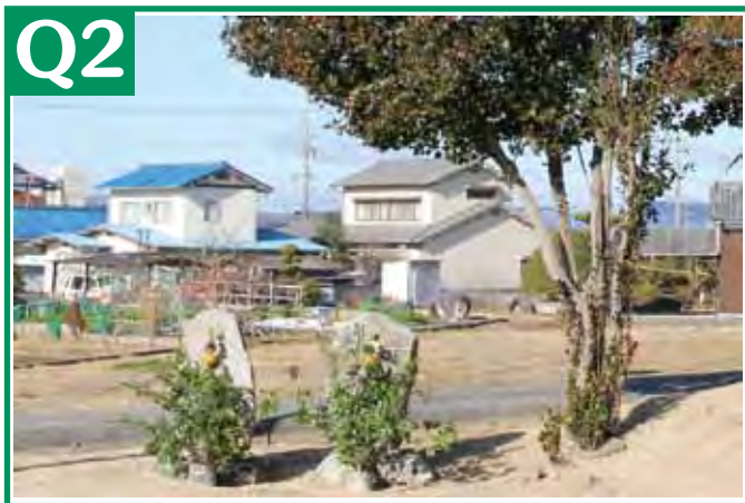
ヒント: 八幡様の近く。のどかで、時間が止まったような空間。