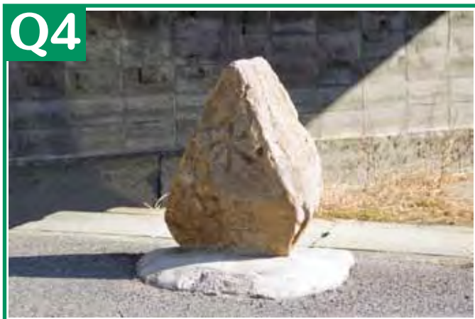
ヒント: 吉備小の生徒ならすぐわかる!