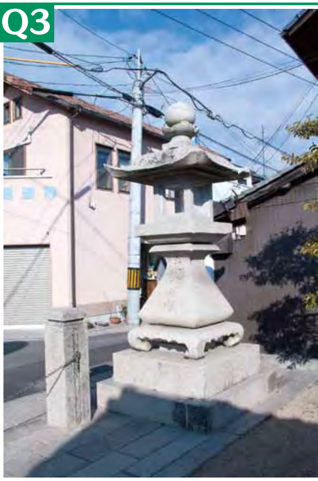
ヒント: 昔は土手の上にあったんだけどなあ…