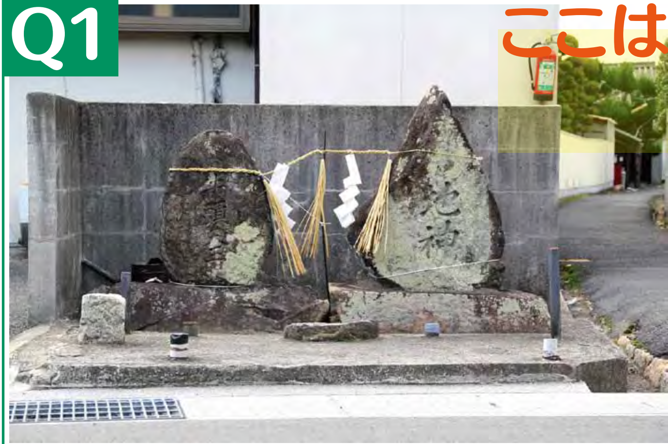
ヒント: 庭瀬駅への通勤通学路で、毎日目にしていてもいるはず。