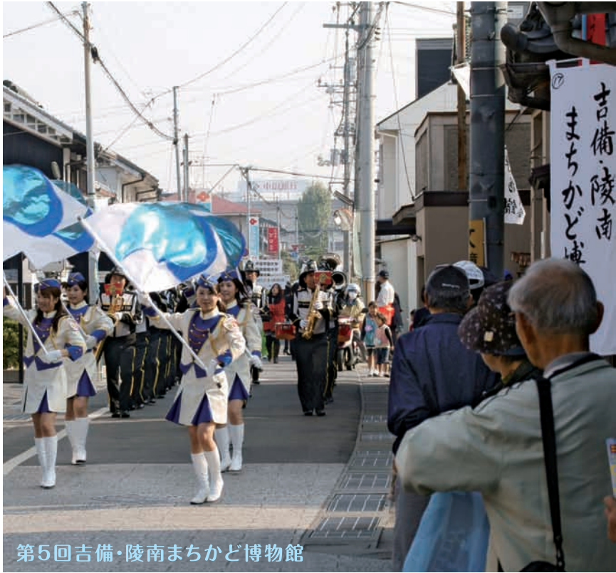
第5回吉備・陵南まちかど博物館