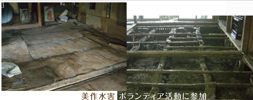
美作水害 ボランティア活動に参加