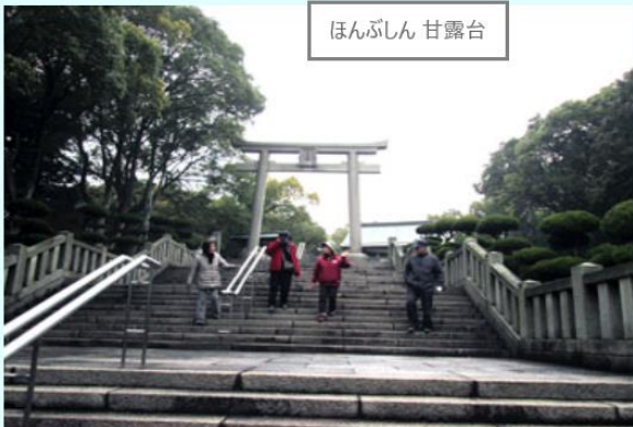
5 ほんぶしん 甘露台