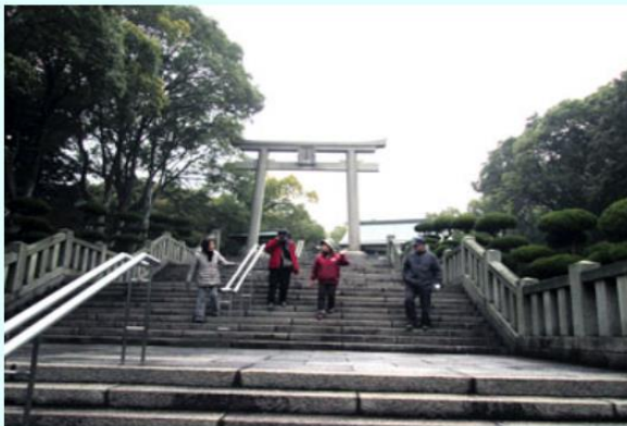
ほんぶしん 甘露台