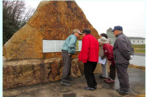
2 宇喜多直家 国とりはじめの地 碑