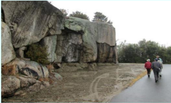
3 祇園社近くの大岩