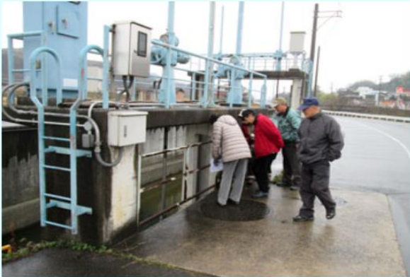
1 千町川の水門見学

日時：平成26年3月5日(水)9時30分 神崎 両備プラッツ駐車場集合～16時解散