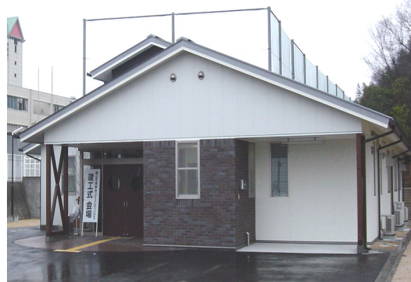
城東台コミュニティハウス全景

今後は、城東台学区コミュニティ協議会が、岡山市の指定管理者としてハウスの運営管理を行います。